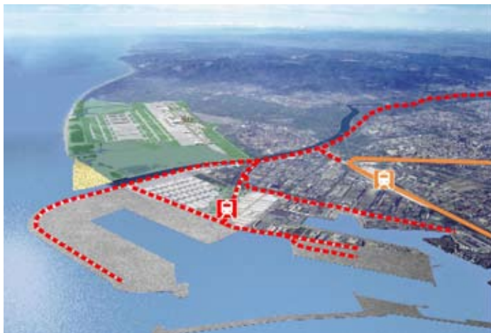
Àrea del Delta del Llobregat